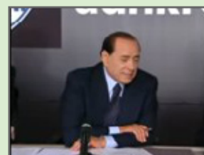
Non tutti sanno usare internet - Silvio Berlusconi e la rete