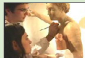
L'Istituto per il Restauro di Palazzo Spinelli Di Firenze - Centro di studi di rilevanza internazionale