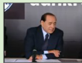
Non tutti sanno usare internet - Silvio Berlusconi e la rete